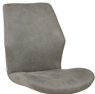
Dalyan ohne Armlehne