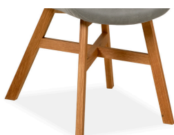
Gestell 2 Kreuzfußgestell Eiche massiv geölt