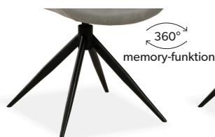
Gestell 3 Drehgestell Metall schwarz