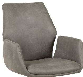
Dalyan mit Armlehne