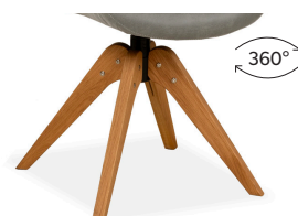
Gestell 5 Drehgestell Eiche massiv geölt