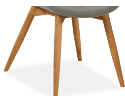
Gestell 1 4- Fußgestell Eiche massiv geölt