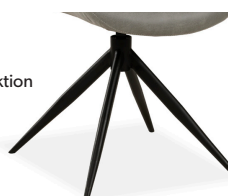
Gestell 4 Spider - Gestell Metall schwarz